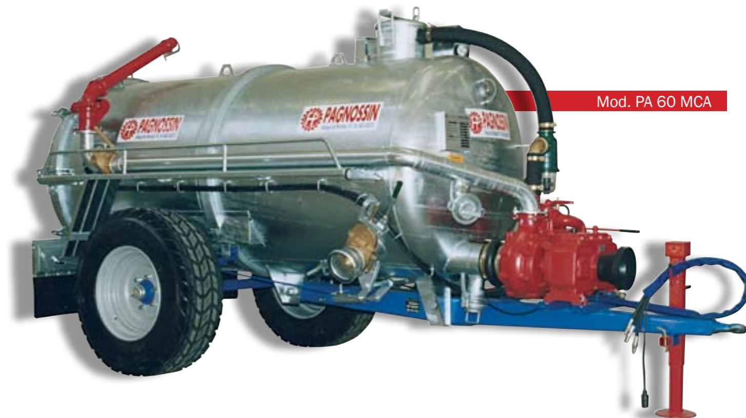
Mod. PA 60 MCA