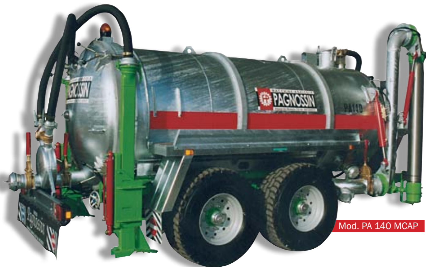
Mod. PA 140 MCAP