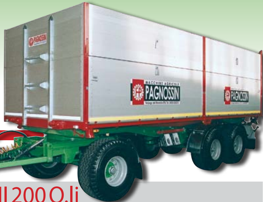
Mod. PA 200 RT BMP